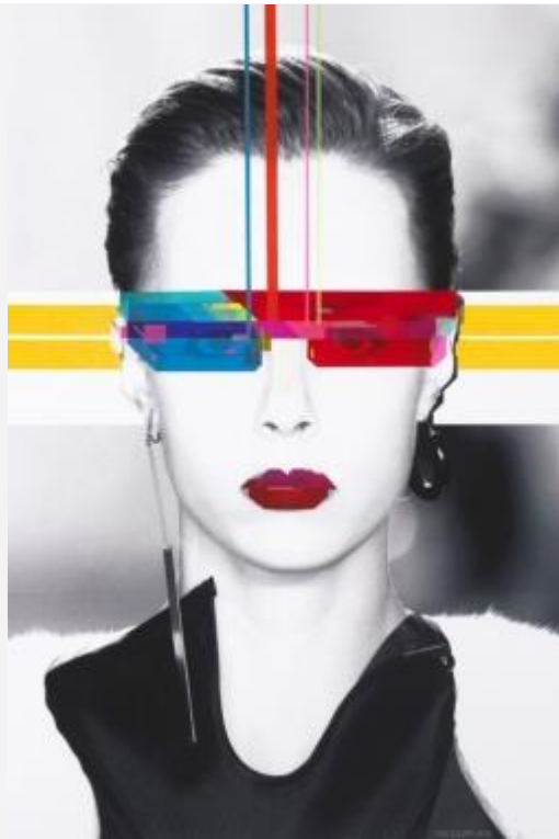
NO CURVES – Cyber Queen

Le sue opere sono nette, non ammettono rotondità, niente curve; i contorni marcano e accentuano singole sezioni delle figure. Non sono opere fondate sulla geometria, ma sulla astrazione plastica , riflettendo sulla spazio e sulla superficie. I suoi lavori hanno l'energia e la libertà tipica del punk, ma allo stesso tempo ricordano i video-games.